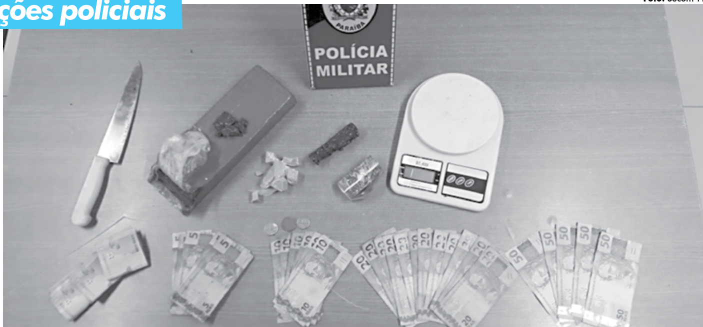
Em duas comunidades de João Pessoa, os policiais apreenderam cocaína, maconha, crack e dinheiro, além de uma balança de precisão