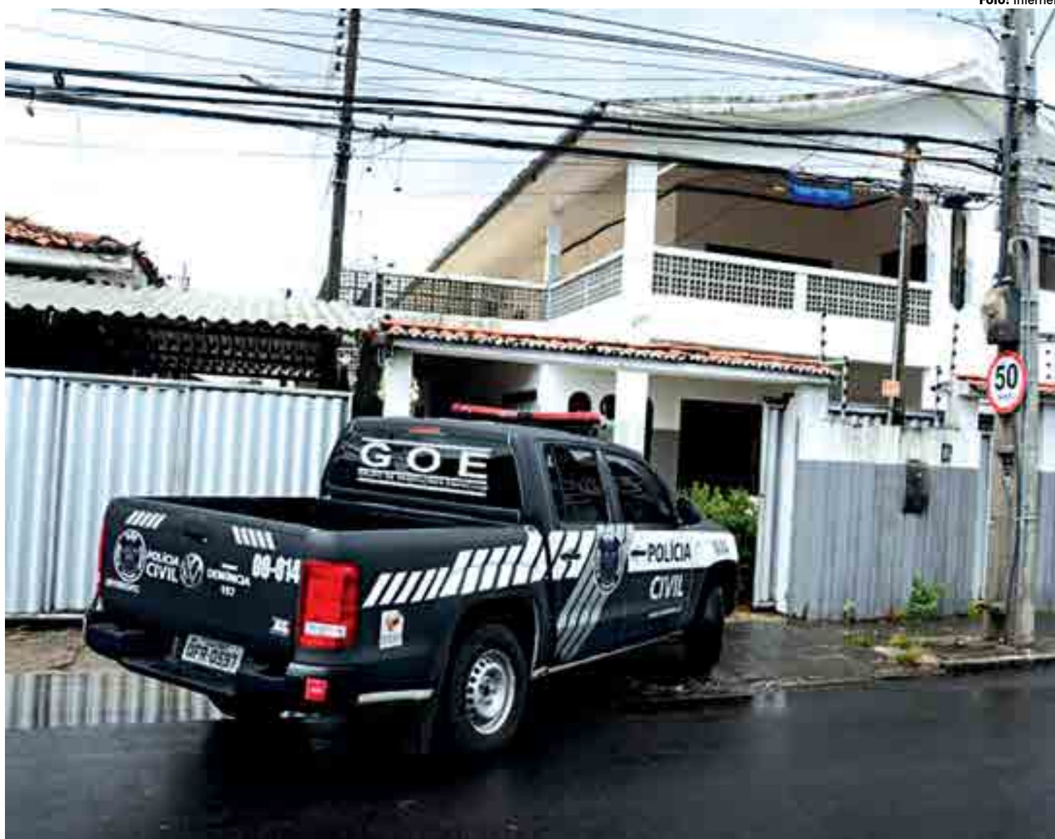
Os envolvidos são acusados de fraudar licitações e também pelo desvio e apropriação de recursos públicos causando um prejuízo de mais de R$ 50 mil aos cofres de Conde

Os envolvidos na trama, irão responder pelos crimes previstos nos seguintes artigos: art. 90 da Lei nº 8.666/93; art. 1º, inciso I, do Decreto-Lei nº 201/67 (12 vezes), c/c o art. 71, do Código Penal; arts. 15 da Lei nº 7.802/89 e 56 da Lei nº 9.605/98; tendo o Ministério Público requerido, ainda, a perda de cargos e funções públicas, reparação pelos danos materiais e morais praticados, entre outras medidas pertinentes.