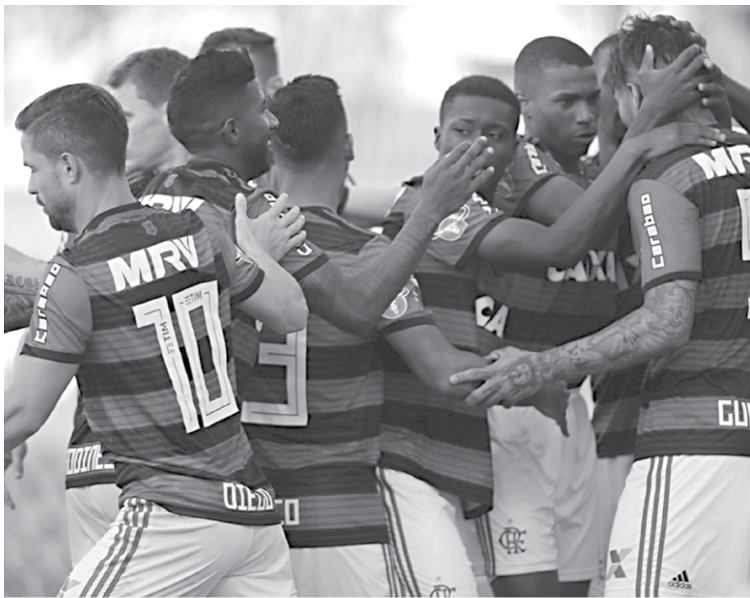
Para o Flamengo, o jogo de hoje contra o Emelec é o mais importante do ano, já que uma vitória classifica a equipe para a 2ª fase da Libertadores

- Não é o tropeço de hoje que vai mudar nada. A equipe vem em uma crescente, resultados positivos. Em uma situação boa em todas as competições. Estamos preparados e chegaremos nesta quarta-feira psicologicamente fortes e prontos para um bom resultado.