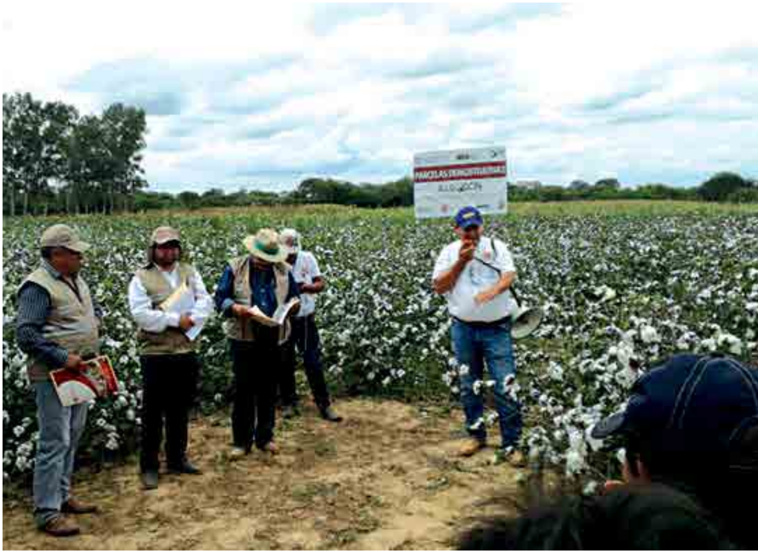
Projeto Regional de Fortalecimento do Setor Algodoeiro visa contribuir para o desenvolvimento sustentável, beneficiando agricultores familiares e indígenas

talecimento do Setor Algodoeiro, por meio da Cooperação Sul-Sul é uma iniciativa realizada na Argentina, Bolívia, Colômbia, Equador, Paraguai e Peru, com envolvimento de governos, da Agência Brasileira de Cooperação do Ministério das Relações Exteriores (ABC/MRE), Instituto