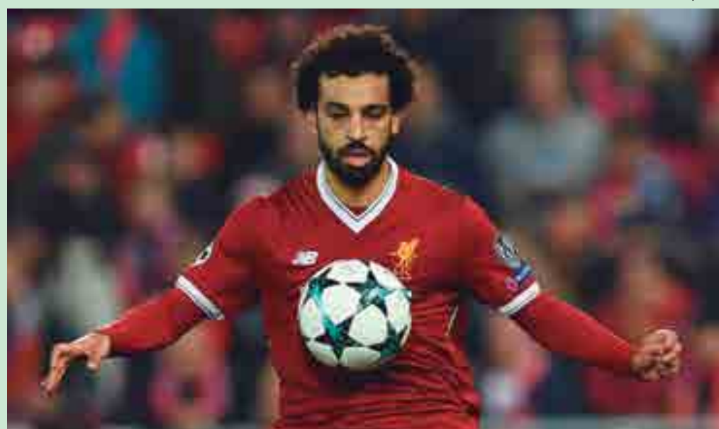
Salah, destaque do Liverpool, é o grande nome da seleção do Egito a para a Copa do Mundo da Rússia