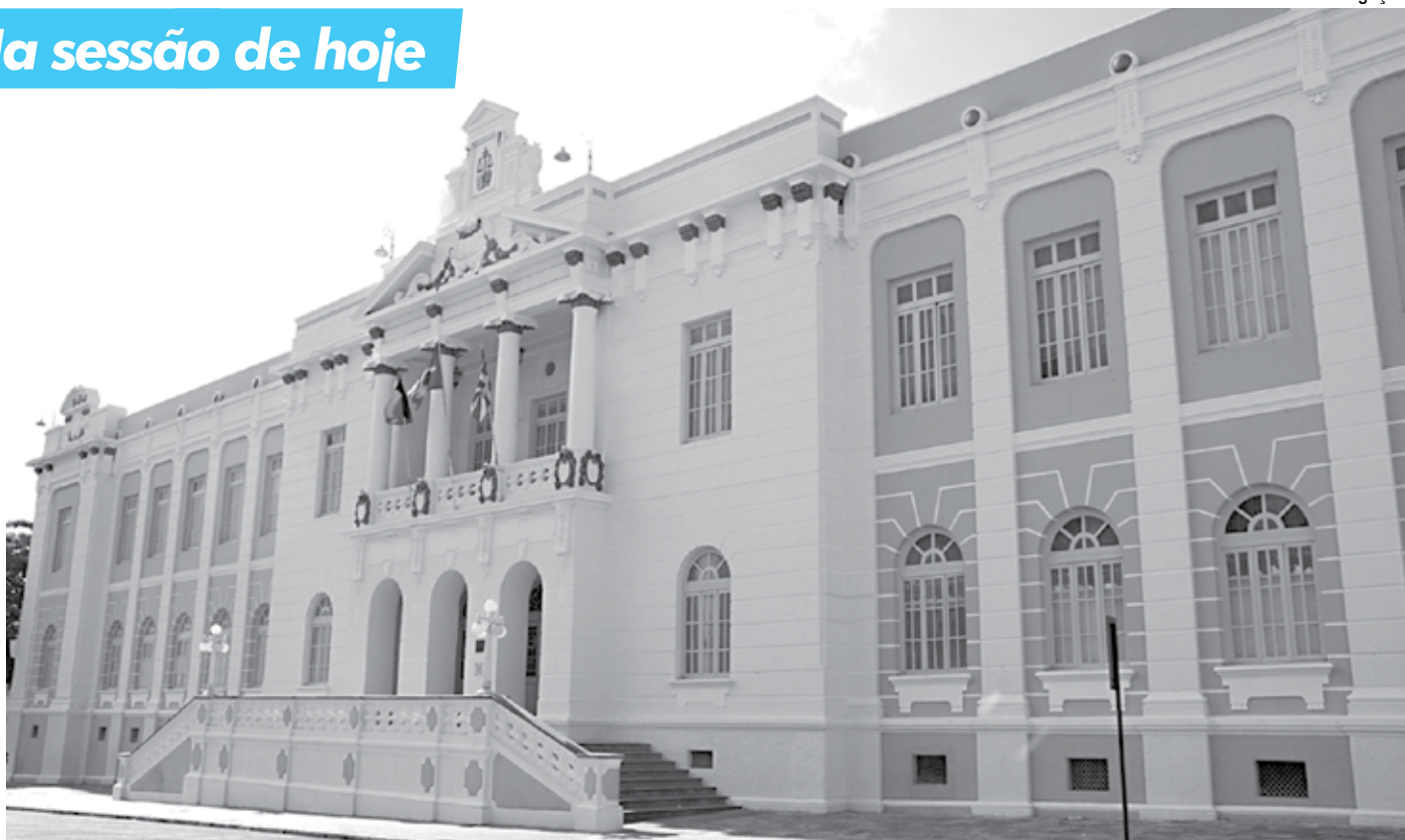
A 9ª sessão administrativa do Pleno do Tribunal de Justiça da Paraíba terá início a partir das 14h, no 1º andar do Anexo Administrativo Desembargador Archimedes Souto Maior