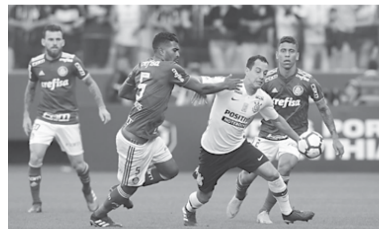
Verdão tenta vitória que garante vantagem na próxima fase da Libertadores

Após duelar com o time colombiano, o Palmeiras encara Bahia (Campeonato Brasileiro), América-MG (oitavas de final da Copa do Brasil) e Sport (Campeonato Brasileiro). Os três confrontos também serão disputados