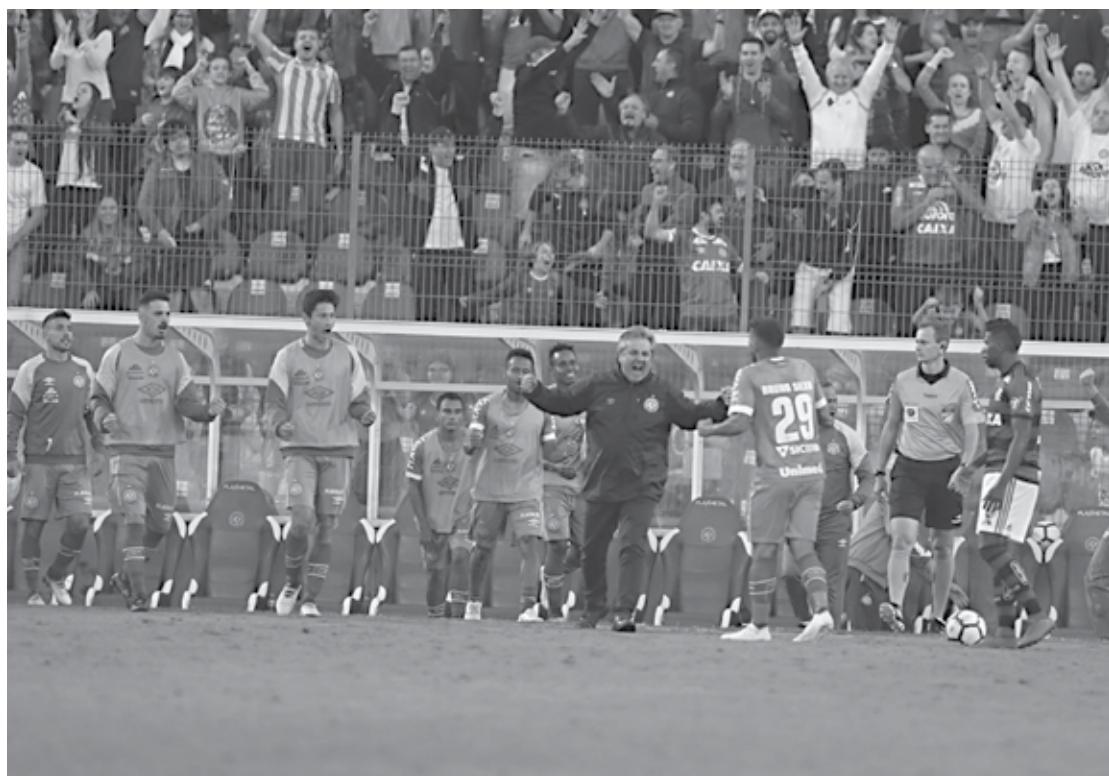
Após a primeira vitória no Brasileirão, contra o Flamengo, a Chapecoense quer a classificação na Copa do Brasil