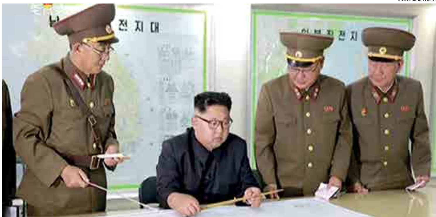
O líder da Coreia do Norte, Kim Jong-un, considera uma provocação a realização de manobras das forças aéreas americanas e sul-coreanas na península

formaram ontem que continuem os preparativos para a aguardada cúpula, no mês que vem, entre o presidente Donald Trump e o líder norte-coreano Kim Jong Un, após Pyongyang lançar dúvidas sobre o evento.