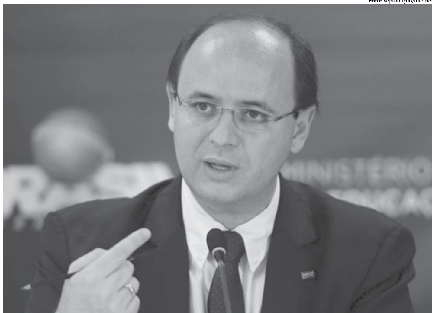
Ministro da Educação, Rossieli Soares, lembrou que, em 2018, após sete anos sem nenhum reajuste, o repasse para merenda teve o primeiro aumento

Rossieli lembrou que Minas Gerais é um Estado importante, bem posicionado economicamente, mas que, ainda assim, tem regiões próximas aos indicadores nega-