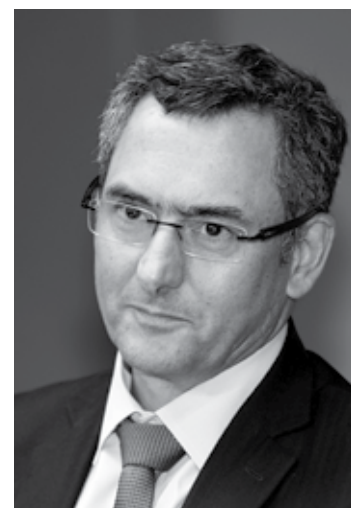
Ministro da Fazenda Eduardo Guardia

Matéria publicada na edição de ontem (15) do jornal Valor Econômico diz que a União cederá à Petrobras entre 1 e 2 bilhões de barris de petróleo a mais na revisão do contrato,