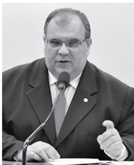
O político campinense faleceu no último domingo (13)

Atualmente estava pontificando no Congresso Nacional, na Câmara dos Deputados, onde tinha cadeira cativa por seu trabalho diuturno em favor da Paraíba e dos paraibanos. Missões superiores o chamaram para dar sua valiosa contribuição, para a qual